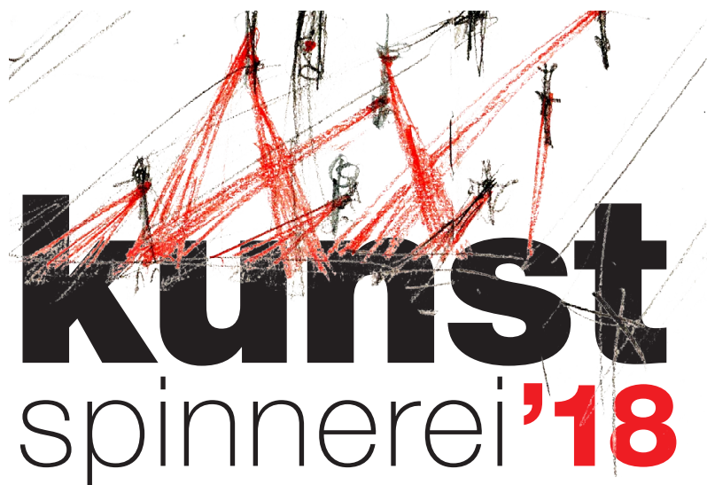
Das Projekt zum 10-Jahre-Jubiläum des Kunstvereins Oberer Zürichsee